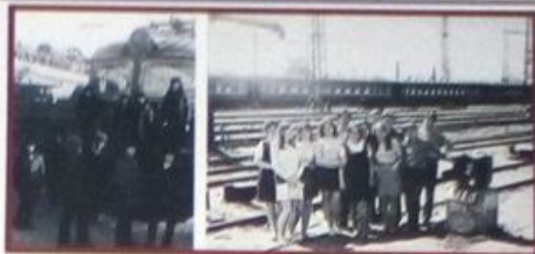
экскурсия на железную дорогу, ст. Куйбышев. 1972г.