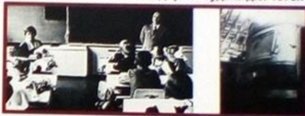
урок профориентации в 5"а" классе школы №36. 1975г.