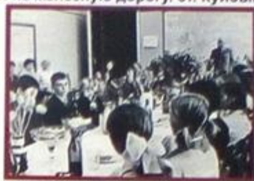
прием учащихся школы №36 у начальника Куйбышевской железной дороги судака д.с. 1973г.