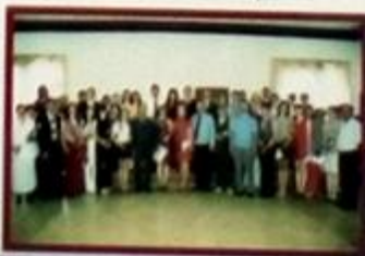
Бал выпускников медалистов у начальника ж/д

Педагогический коллектив и учащиеся были лично знакомы с руководителями многих предприятий ж/дорожного транспорта.